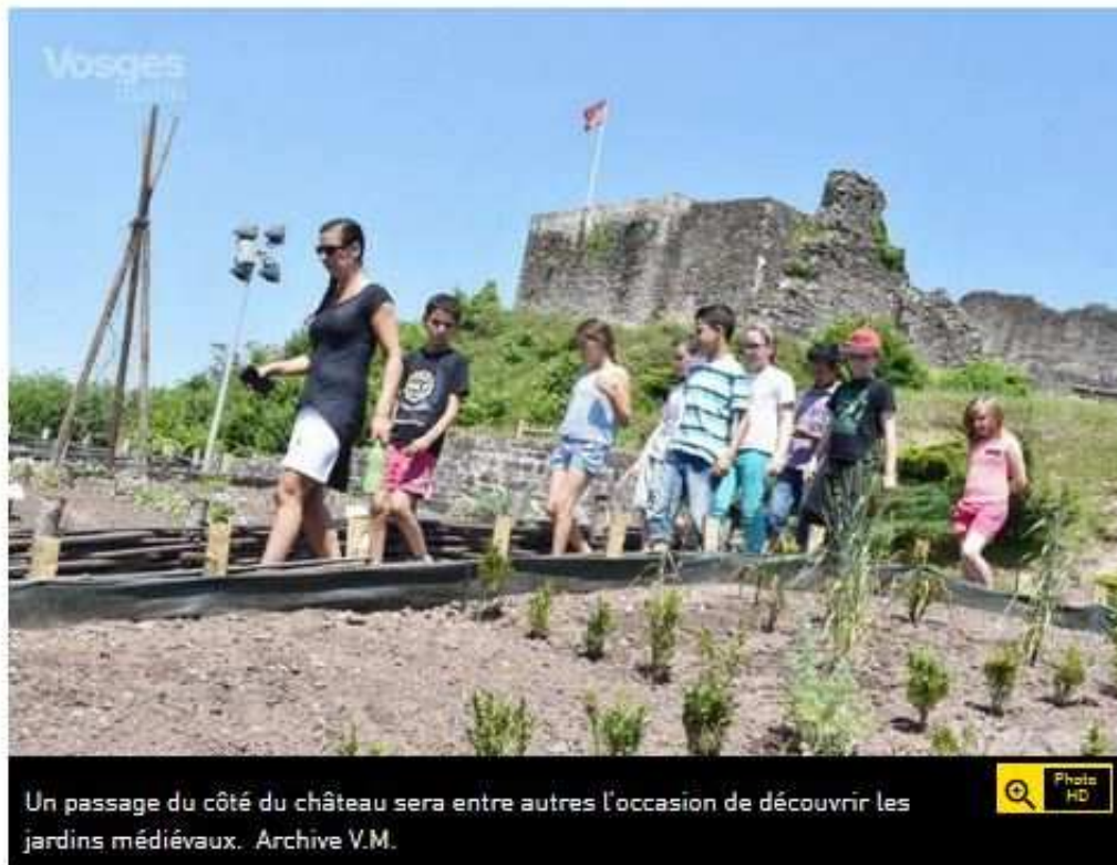
Un passage du côté du château sera entre autres l'occasion de découvrir les jardins médiévaux.

VU 68 FOIS | LE 23/05/2017 À 05:00 | 0 RÉAGIR