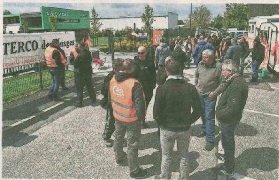
Une quarantaine d'agents du Sicovad avaient fait grève le 28 avril dernier à l'appel de CFDT Intercô Vosges.