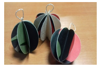
Des boules de Noël