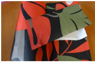
Des chutes de papier-peint