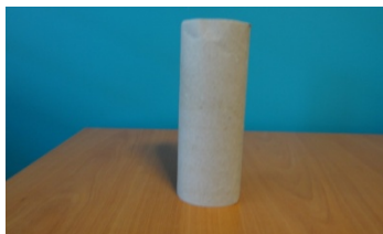
1rouleau de papier toilette