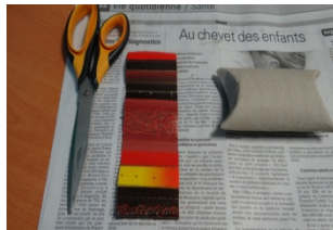
Du papier cadeau